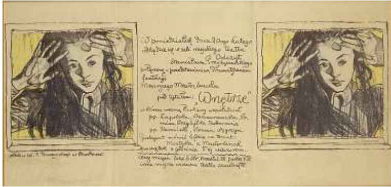
Stanisław Wyspiański, Wnętrze, 1899

Na ziemiach polskich u schyłku XIX w., kiedy nadal działali Jan Matejko, Juliusz Kossak, Wojciech Kossak, Henryk Rodakowski, pojawiła się kolejna generacja wybitnych artystów: Józef Chełmoński, Aleksander Gierymski, Maksymilian Gierymski, Leon Wyczółkowski, Władysław Podkowiński, Jacek Malczewski, Wacław Szymanowski, Józef Mehoffer, Stanisław Wyspiański, Tadeusz Makowski, Władysław Skoczylas, Xawery Dunikowski.