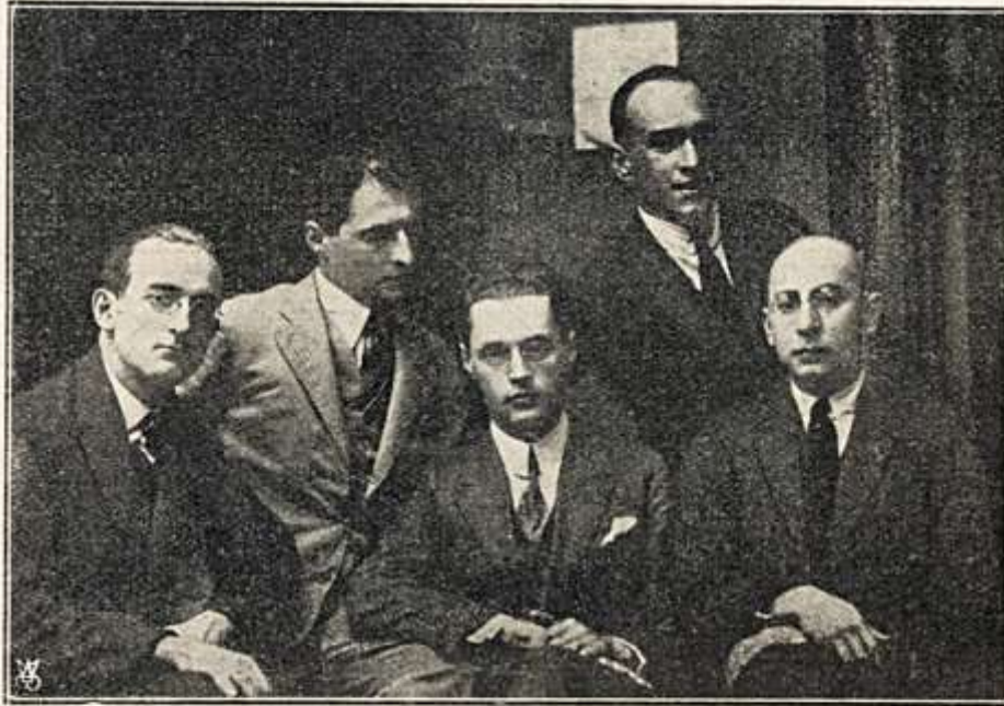
JAN LECHOŃ, JULJAN TUWIM, KAZIMIERZ WIERZYŃSKI, JAROSŁAW IWASZKIEWICZ, ANTONI SŁONIMSKI

Grupa poetów, która uformowała się ok. 1919 r. wokół miesięcznika poetyckiego „Pro Arte et Studio” i kawiarni „Pod Picadorem”. Jej trzon stanowili: Jan Lechoń, Julian Tuwim, Jarosław Iwaszkiewicz, Antoni Słonimski i Kazimierz Wierzyński.