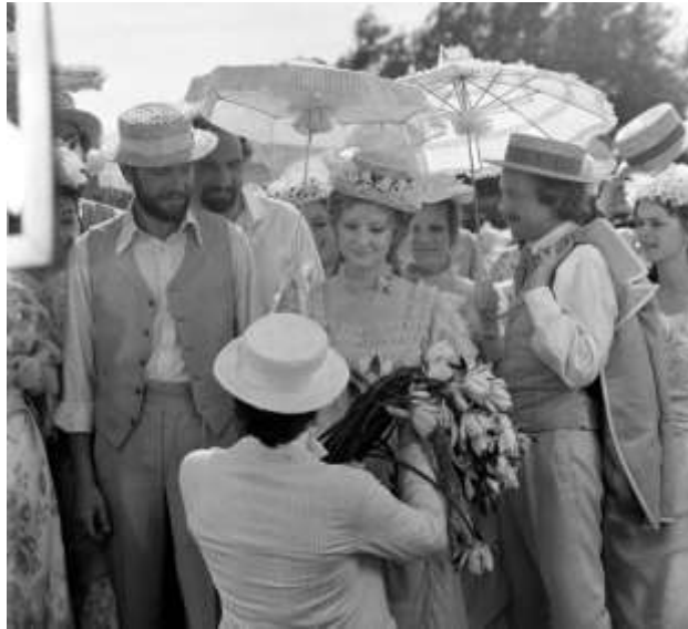
• Kadry z filmu Noce i dnie w reżyserii Jerzego Antczaka, 1975